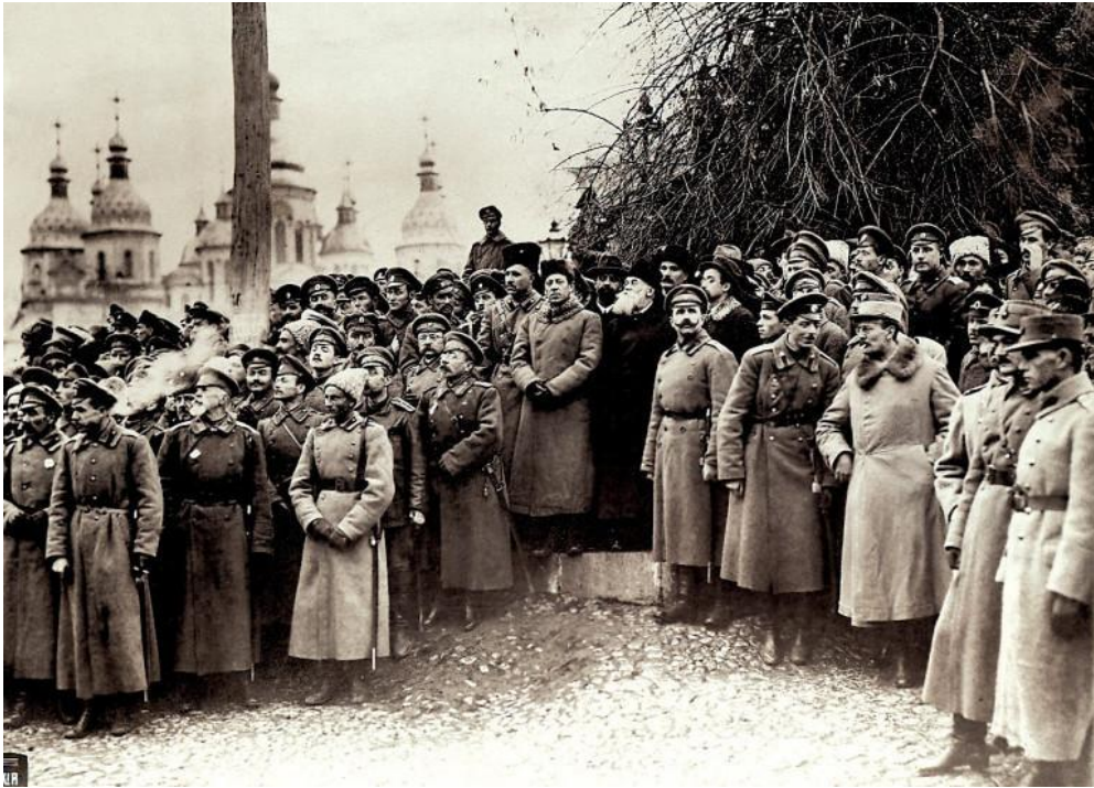
Мітинг з нагоди відкриття III Всеукраїнського військового з'їзду (в центрі – Симон Петлюра, Михайло Грушевський та Володимир Винниченко). Листопад 1917 року