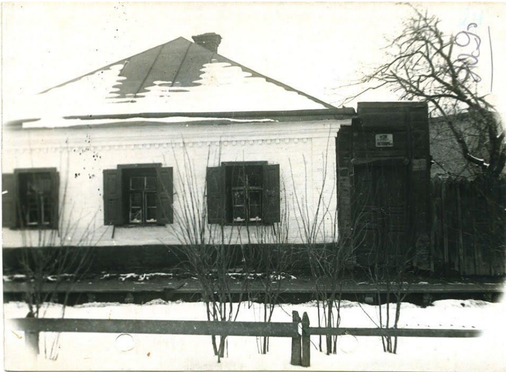
Будинок родини Симона Петлюри (вигляд з вулиці). 1937 рік