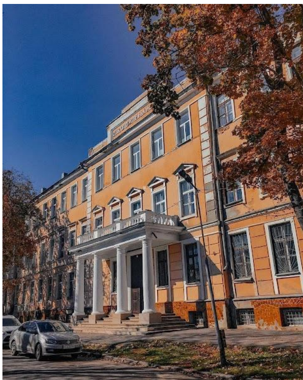
Колишня духовна семінарія. Тут Симон Петлюра навчався від 1895 по 1902 роки.